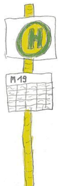
L'arrêt du bus

On arrive au lycée et on regarde notre emploi du temps. Le plus souvent, je finis à 12h ou à 13h, la dernière fois je suis allé manger un kebab près du métro aérien. Je fais aussi partie d'un club « Le Grand méchant loup » qui fait un journal avec des interviews de personnes connues, une BD, etc.