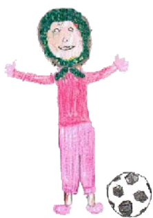
Une joueuse voilée

on va en trouver beaucoup venant d'Afrique du Nord. Chez les filles de la même origine, les parents vont plus dire, non non, tu vas pas jouer au foot, c'est un sport d'homme, tu restes à la maison, donc c'est plus une question de moeurs.